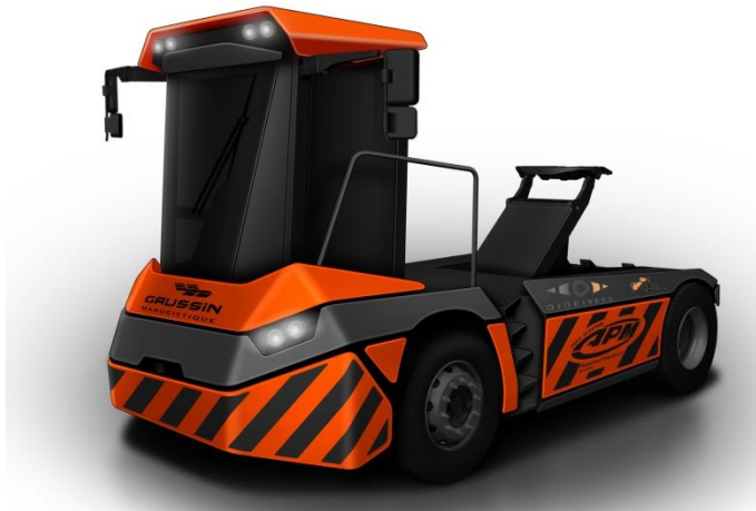
L'APM 75t - Autonomous Prime Mover

GAUSSIN et DIGIROBOTICS avaient déjà présenté au salon TOC Amsterdam en juin 2017 la gamme APM « Autonomous Prime Mover ». L'APM, nouveau tracteur communément appelé Prime Mover dans le secteur portuaire, est le premier tracteur GAUSSIN à bénéficier d'un kit de conversion TRUGO, développé par DIDRIVER. TRUGO permet de robotiser le véhicule lourd en conduite autonome, c'est-à-dire avec ou sans chauffeur, en mode automatique en utilisant la « navigation naturelle » qui permet de s'affranchir des équipements et infrastructures traditionnels.