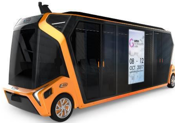
BeGAU 24 passagers FULL ELECFULL ELEC

La 1 ère version de BeGAU a été présentée au salon GITEX qui s'est tenu à Dubaï du 8 au 12 octobre 2017 et sera présenté au salon CES 2018 à Las Vegas en janvier 2018. Les 1 ers essais de BeGAU en conditions réelles auront lieu à Dubaï au cours du 2 ème semestre 2018. Les véhicules seront fabriqués par la société Gaussin à Héricourt et les deux partenaires participeront conjointement aux différents appels d'offre à travers le monde.