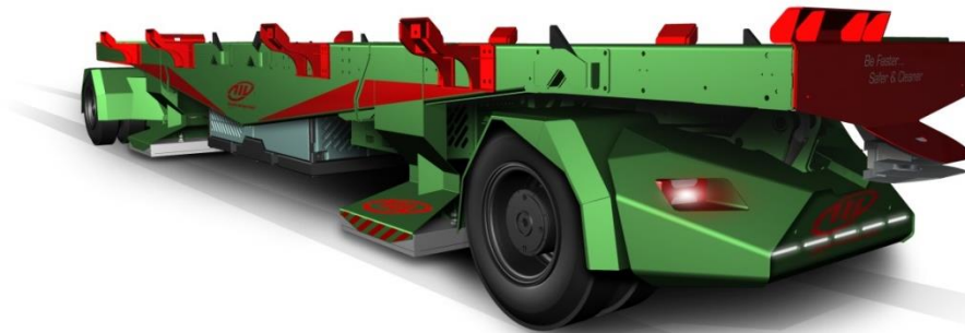
AIV LIFT FULL ELEC

L'équipe du groupe GAUSSIN MANUGISTIQUE en charge de ce projet depuis l'été 2014 a constitué une flotte de 5 AIV FULL ELEC dont les premiers tours de roues sur la piste d'essai des Guinottes à Héricourt sont envisagés en Mars 2015.